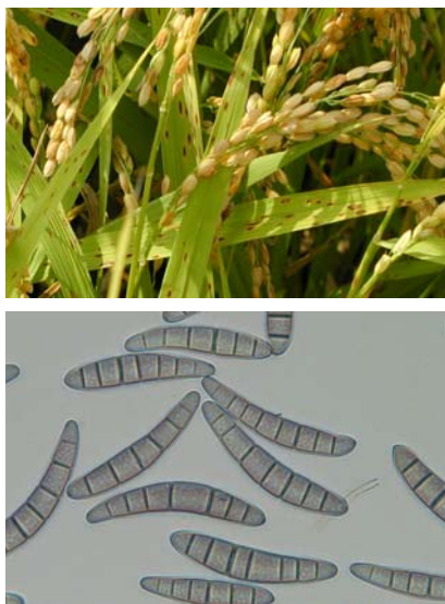
図 1 イネごま葉枯病菌の罹病葉 (上) とイネごま葉枯病菌の分生孢子 (下)

イネに斑点病を引き起こすイネごま葉枯病菌 ( Bipolaris oryzae ) (図 1) の分生孢子形成は、紫外線 (UVB) によって誘導されるが、その誘導効果は青色光 (UVA/Blue) によって打ち消される、といったユニークな拮抗的光反応によって調節されている (図 2)。日本各地から分離したイネごま葉枯病菌の 99%以上がこの光調節反応を持つ「光誘導型」であり、さらに胞